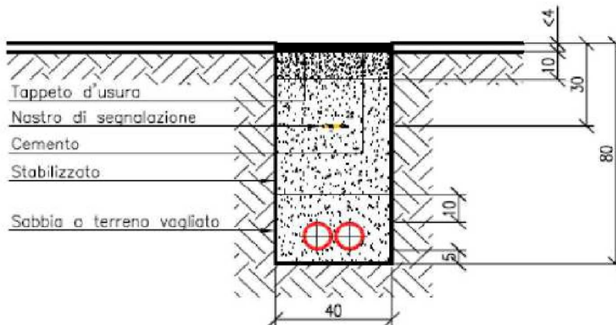
Figura B - Sezione tipo scavo tradizionale su marciapiede/pista ciclabile/area pedonale