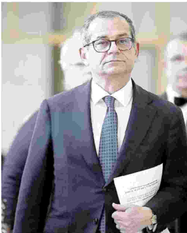
Giovanni Tria, ministro dell'Economia

L'OBIETTIVO È SCOPRIRE LE ENTRATE IN NERO SARÀ SEMPRE POSSIBILE FAR VALERE LE PROPRIE RAGIONI SE SCATTA LA CONTESTAZIONE